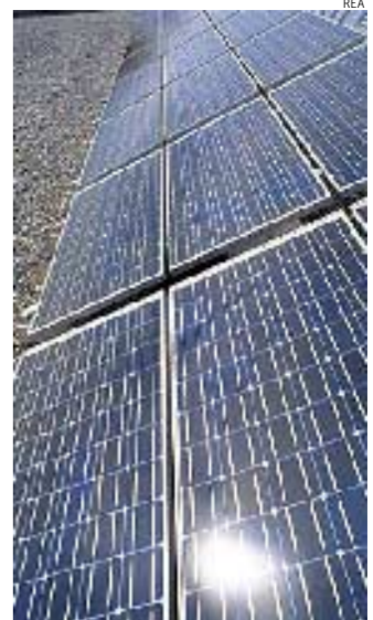
Energia solare. A Brindisi impianto fotovoltaico per l'aeroporto

AEROPORTI DI PUGLIA SPADI BARI Indirizzo: viale Enzo Ferrari -